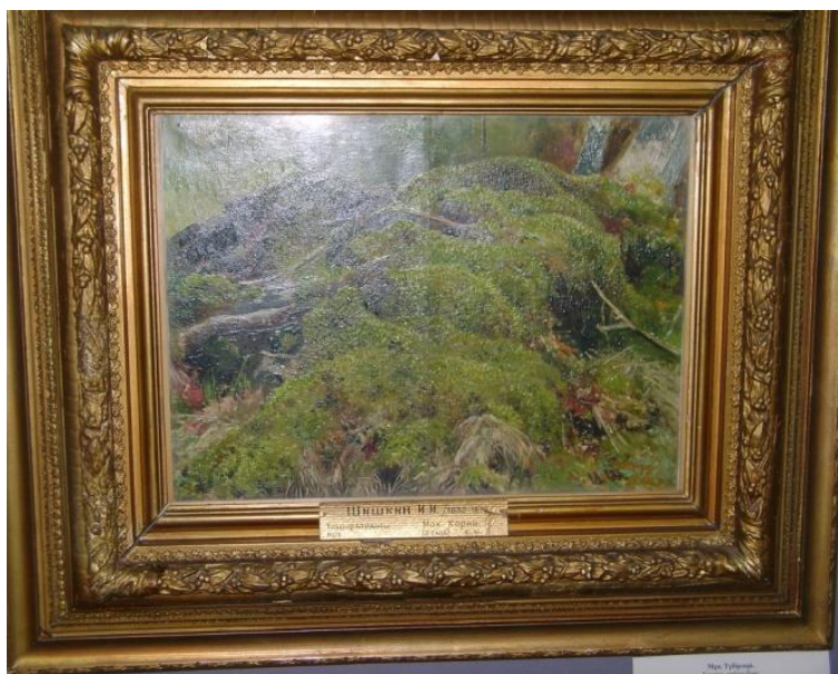
Илл. 1. Шишкин И. «Корни»