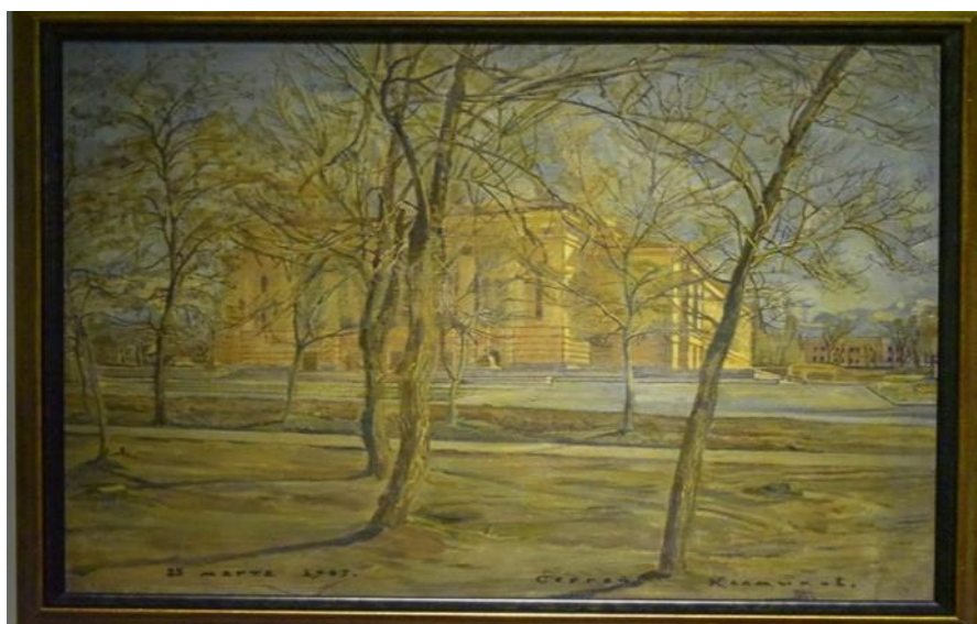
Илл. 6. Калмыков С. «ГАТОБ Оперный театр»