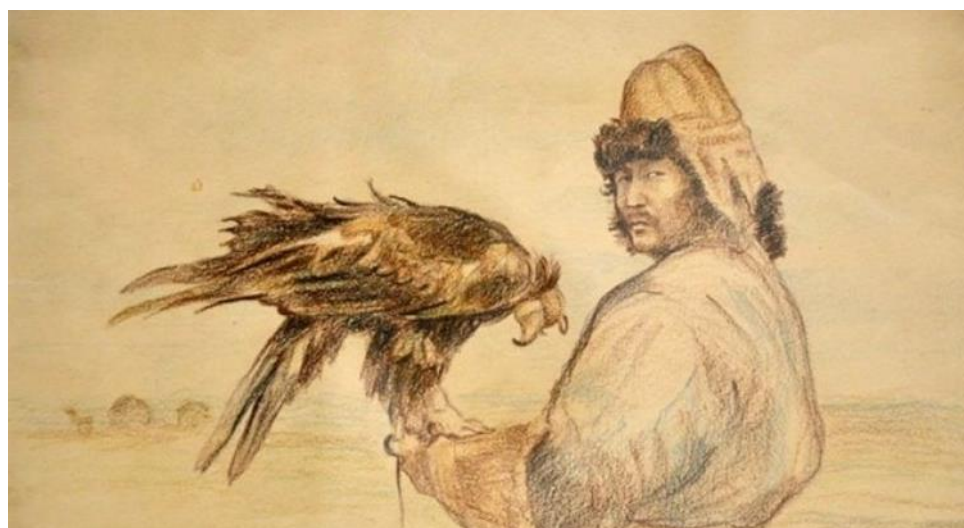
Илл. 4. Каптерев В. «Охотник с беркутом ярки»