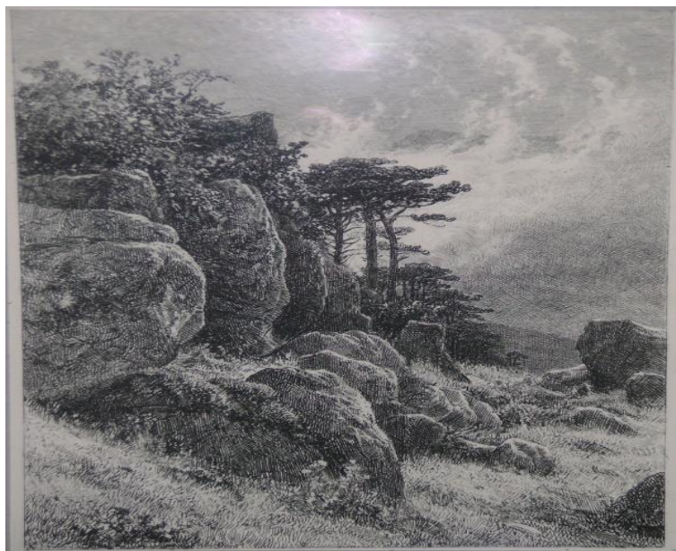
Илл. 3. Шишкин И. «Офорт»