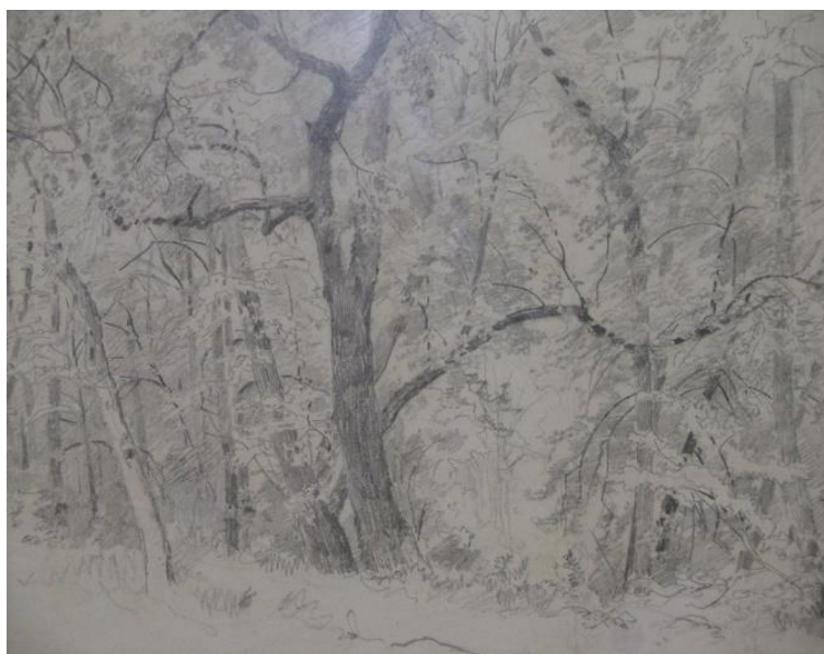
Илл. 2. Шишкин И. «В лесу»