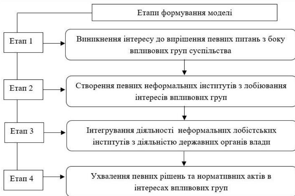
Рисунок 1. Основні етапи розвитку моделі лобізму в Україні (складено автором)

Виходячи з процесів розвитку лобізму в Україні, можна також звернути увагу на досить важливий факт його трансформації упродовж останніх десятиріч. Приміром, у період 2000-2013 рр. вплив різних бізнес-еліт на політичні та нормотворчі процеси в Україні характеризувався своєю відкритістю та незаангажованістю. Також у цей період практично була відсутньою система ідентифікації корупційної складової у діях лобістів. Будь-які активності з точки зору просування інтересів впливових груп розглядалися як легітимні та не переслідувалися законом.