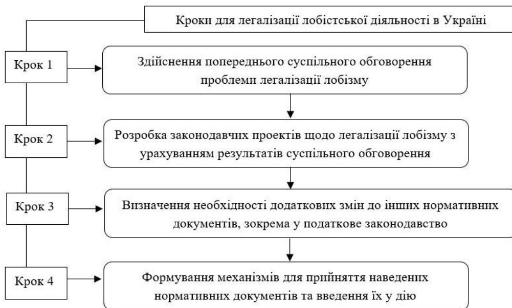
Рисунок 2. Кроки для легалізації лобістської діяльності в Україні (складено автором)