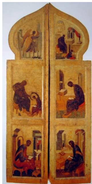
Илл. 2. Царские врата с росписью Андрея Рублёва с каноническими сюжетами Благовещение и изображениями четырех Евангелистов: Луки, Матфея, Марка и Иоанна Богослова