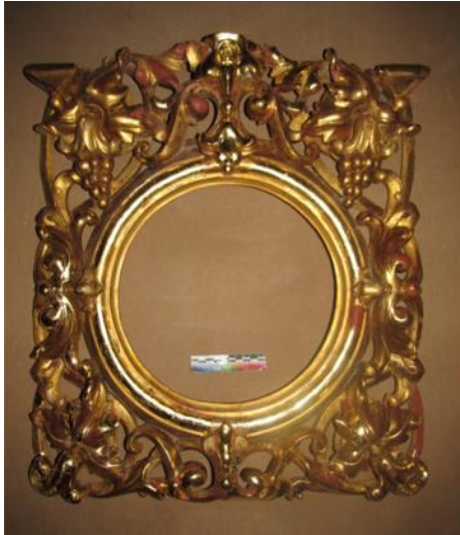
Илл. 16. Лицевая сторона фрагмента створки после локального золочения на полименте