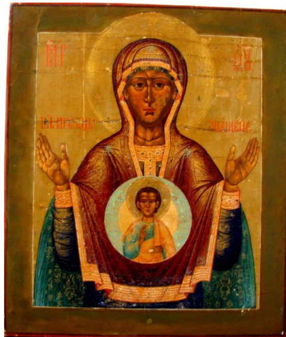
Илл. 21. Икона Толгская. Знамение Пресвятой Богородицы. Аналог иконы, представленной на реставрацию