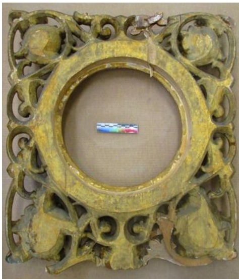
Илл. 10. Тыльная сторона створки после расчистки от загрязнений, потёков и заделок утрат основы