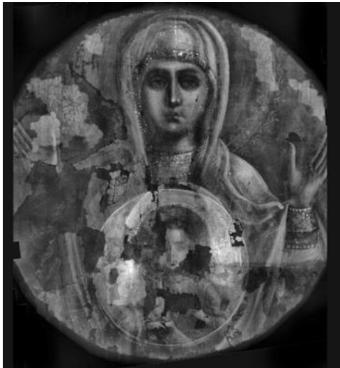
Илл. 24. Рентгеновский снимок иконы «Знамение» с видимыми записями на лицевой стороне иконы и фрагментами левкаса на тыльной стороне.