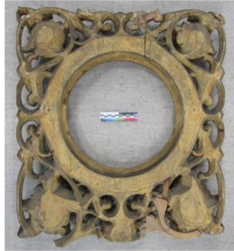
Илл. 9. Тыльная сторона створки после расчистки от загрязнений и потёков на основе