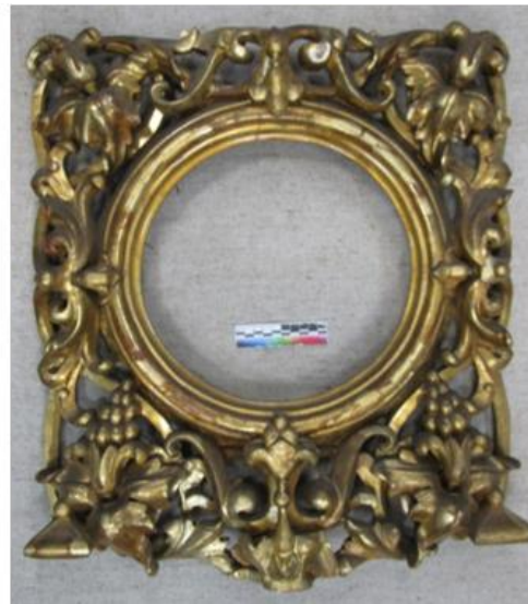
Илл. 7. Лицевая сторона фрагмента створки Царских врат, предоставленный на реставрацию после демонтажа иконы