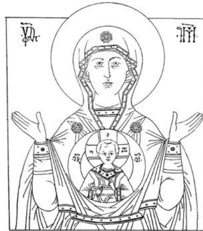
ОБРАЗ ПЕРЕД БОГОМ. ЗНАМЕНИЕ.