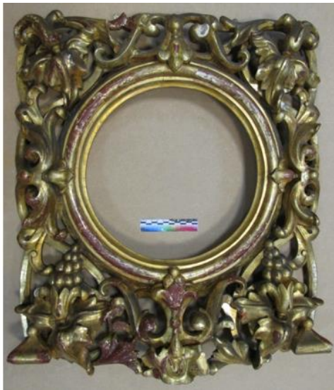
Илл. 11. Лицевая сторона створки после удаления поверхностных загрязнений и позднего лакового покрытия с глянцевой позолоты