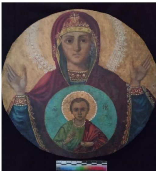
Илл. 26. Икона «Знамение» после консервации, реставрации и выполнения условных акварельных тонировок на восстановленных участках грунта-левкаса