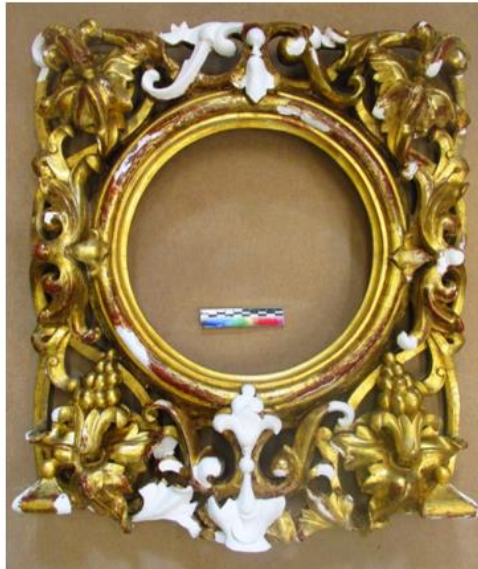
Илл. 13. Лицевая сторона створки после восполнения грунта-левкаса в границах утрат