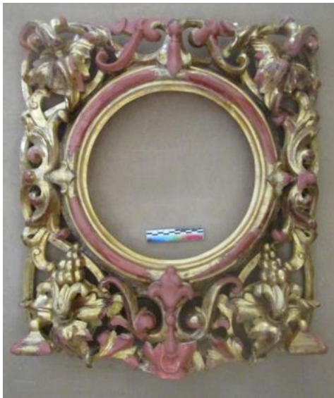
Илл. 14. Лицевая сторона створки Царских врат с нанесённым на места утрат авторского золочения грунтом-полиментом