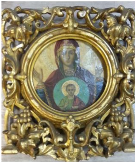
Илл. 6. Общий вид фрагмента створки Царских врат с иконой «Знамение» до реставрации