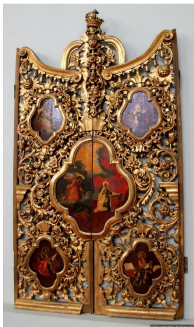
Илл. 1. Пермская государственная художественная галерея. Царские врата с фигурными клеймами. XVIII век