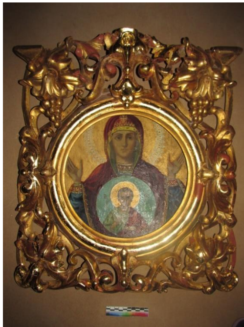
Илл. 18. Лицевая сторона створки Царских врат после консервации и реставрации вместе с иконой «Знамение»