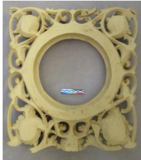
Илл. 17. Тыльная сторона створки после окраски охрой на клее