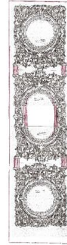
Илл. 5. Царские врата главного иконостаса с прямым верхом и тремя клеймами под иконы. Исаакиевский собор. (1818-58 гг.) Классицизм. Архитектор О. Монферран. Реконструкция Царских врат