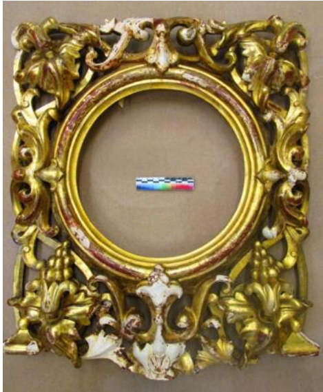
Илл. 12. Лицевая сторона створки после удаления непрофессионального лакового и красочного покрытия