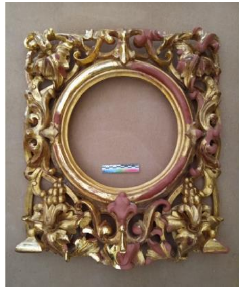
Илл. 15. Лицевая сторона фрагмента створки Царских врат в процессе локального восполнения утрат глянцевого золочения на полименте