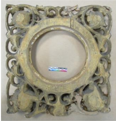
Илл. 8. Тыльная сторона фрагмента створки Царских врат до реставрации