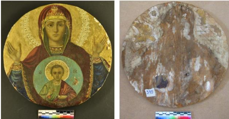
Илл. 19-20. Лицевая и тыльная стороны иконы «Знамение» и «Николая Мирликийского» после демонтажа из фрагмента створки Царских врат до консервации и реставрации