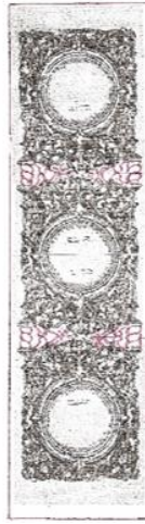
Илл. 4. Царские врата с тремя круглыми клеймами под иконы на каждой створке. Реконструкция створки Царских врат с тремя круглыми клеймами