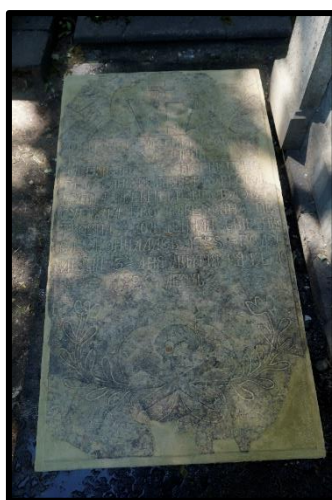
Рисунок 23. Надгробная плита, смонтированная на прежнем месте