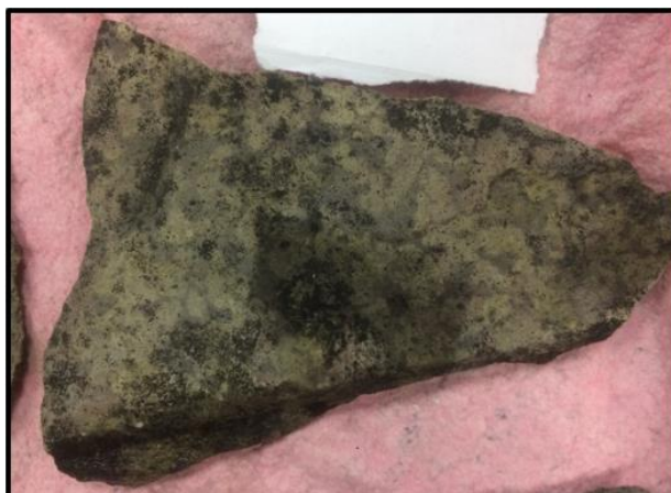
Рисунок 15. Поверхностные загрязнения на фрагменте плиты