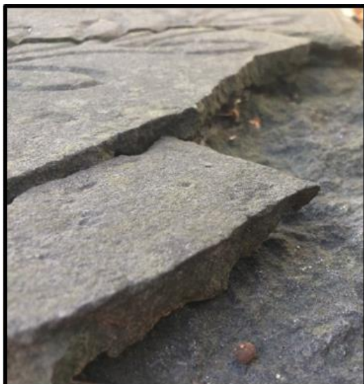
Рисунок 9. Надгробная плита М.П. Нефедовой, расслоившаяся по горизонтальной оси