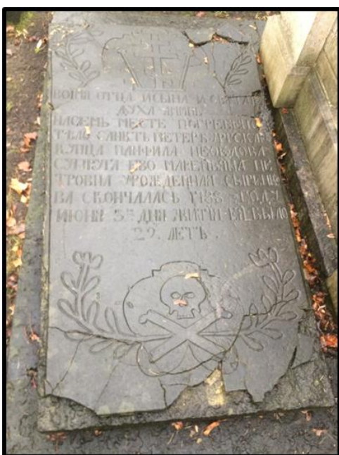
Рисунок 3. Надгробная плита Нефедовой Маремьяны Петровны, Некрополь XVIII века Александро-Невской Лавры