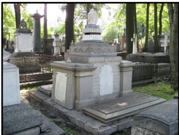
Рисунок 1. Семейный склеп Сыренковых, Некрополь XVIII века Александро-Невской Лавры. Санкт-Петербург