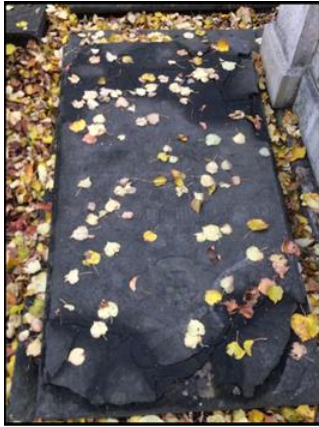
Рисунок 13. Плита М.П. Нефедовой до реставрации. Некрополь XVIII века Александро-Невская Лавра