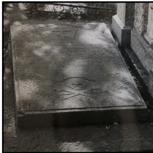
Рисунок 8. Архивное фото 1973 года