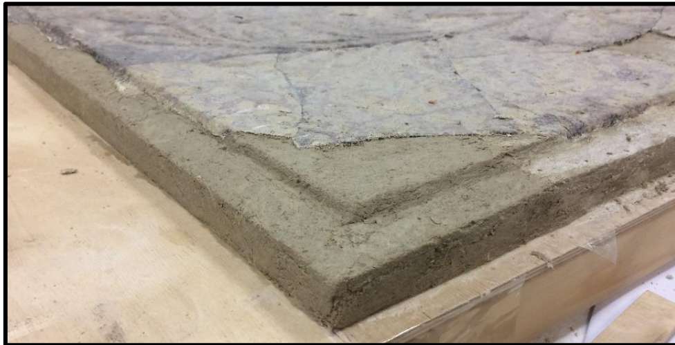
Рисунок 19. Восполнение утрат плиты при помощи камнезаменителя