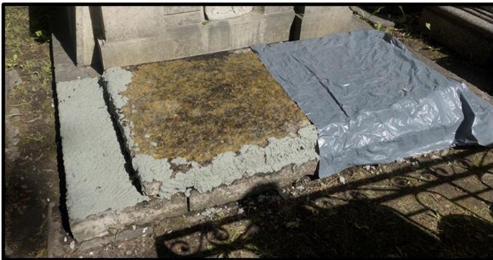
Рисунок 22. Удаление загрязнений при помощи компресса