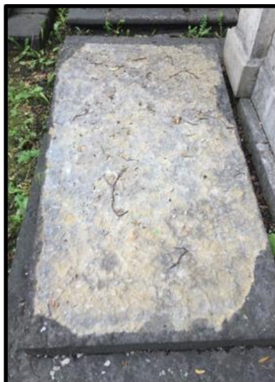
Рисунок 10. Нижняя часть расслоившейся надгробной плиты М.П. Нефедовой