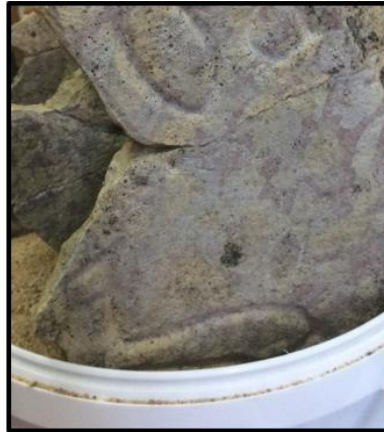
Рисунок 18. Склеивание фрагментов плиты в вертикальном положении