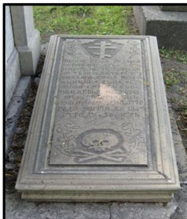
Рисунок 2. Надгробная плита Сыренковой Прасковьи Федоровны Некрополь XVIII века Александро-Невская Лавра