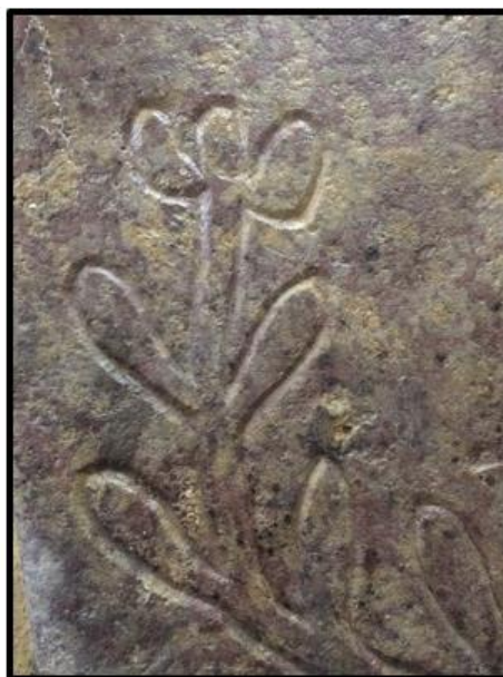
Рисунок 12. Изображение стилизованных цветов на надгробной плите М.П. Нефедовой