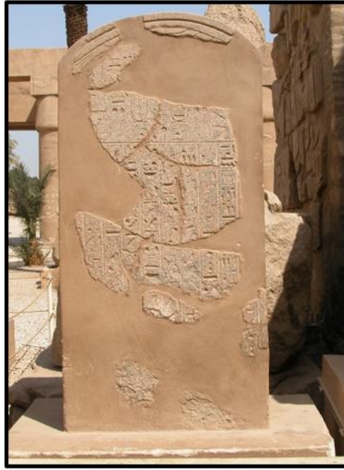
Рисунок 6. Пример консервации мемориальной плиты. Храм Амона, г. Луксор, Египет