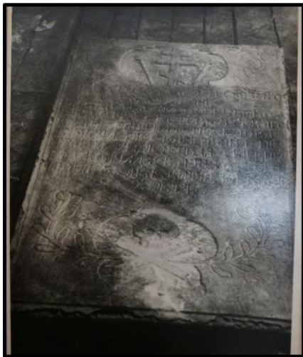
Рисунок 7. Архивное фото 1962 года