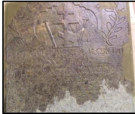
Рисунок 21. Покрытие поверхности плиты биоцидным составом