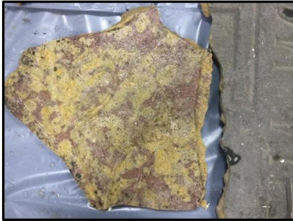
Рисунок 17. Естественный цвет материала плиты