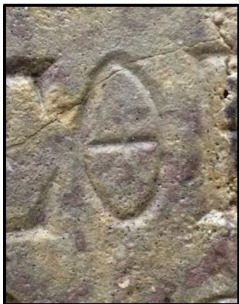
Рисунок 11. Написание буквы Ф на надгробной плите М.П. Нефедовой