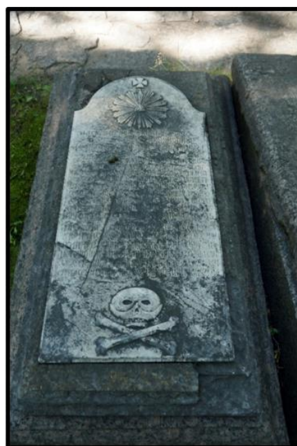
Рисунок 4. Надгробная плита, мрамор, Санкт-Петербург, Некрополь XVIII века