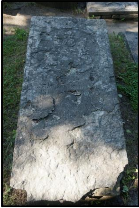
Рисунок 5. Следы выветривания на надгробной плите из известняка. Санкт-Петербург, Некрополь XVIII века