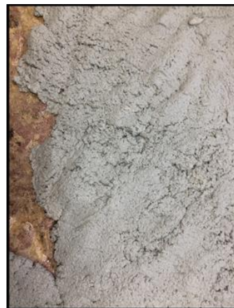
Рисунок 16. Удаление стойких поверхностных загрязнений с фрагментов плиты при помощи компресса